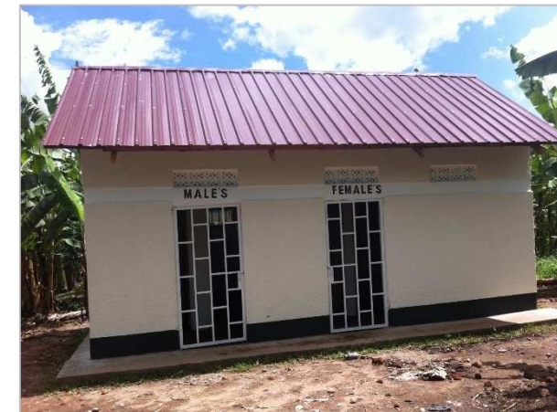
Bild: Bau des neuen Toilettenhauses 11/2015