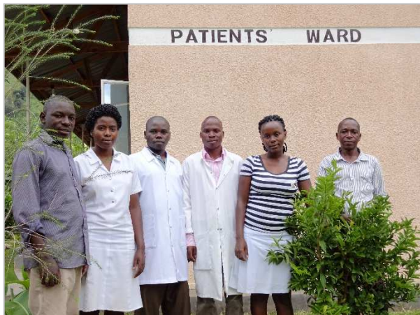
Bild: Krankenpflegepersonal, sowie stellvertretender Direktor und Vorstand.

Das Personal leistet wichtige Arbeit vor Ort. Täglich kommen zwischen 14-25 Patienten, die z.T. kostenlos vor allem gegen Typhus, Malaria, Aids, Syphilis, Gonorrhö, Bluthochdruck und Diabetes behandelt werden.