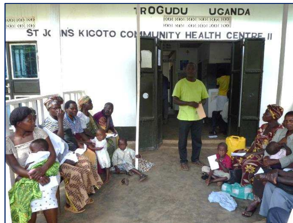
Bild: Wartende Patienten vor der Behandlung