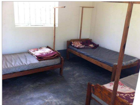
endlich helle und freundliche Patientenräume