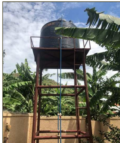
Bild: Wassertank bei der Station

Durch einen Spendenaufruf im Jahr 2021 konnten zusätzlich Lebensmittel für arme Familien gekauft und verteilt werden. Ebenfalls werden wir, sofern es die Spendeneingänge ermöglichen, ein uns bekanntes Waisenhaus, Straßenkinder, sowie eine Grundschule und befreundete Pfarreien in Uganda unterstützen.