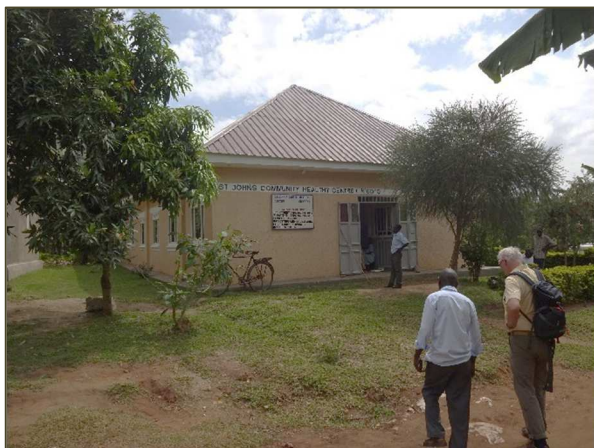
Bild: Gesundheitsstation 2019