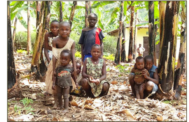
Bild: Dorfkinder in Kigoto